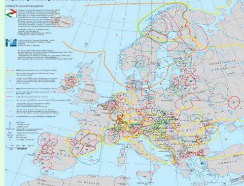
Regionen grenzübergreifender Zusammenarbeit 2007

Die Studie bietet einen Infos über die grenzübergreifende Zusammenarbeit in einigen ausgewählten Gebieten Südamerikas, einschl. Gute Beispiele, eine SWOT-Analyse, Empfehlungen sowie eine Road Map für grenzüberschreitende Zusammenarbeit in Latein America.