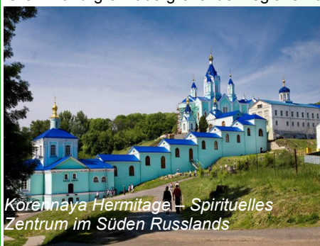
Korennaya Hermitage – Spirituelles Zentrum im Süden Russlands

Die Anregungen und Empfehlungen des Forums in Moskau und der Jahreskonferenz in Kursk richten sich an die EU, an russische und für Nachbarschaft zuständige Institutionen sowie an Grenz- und grenzübergreifende Regionen und alle interessierten