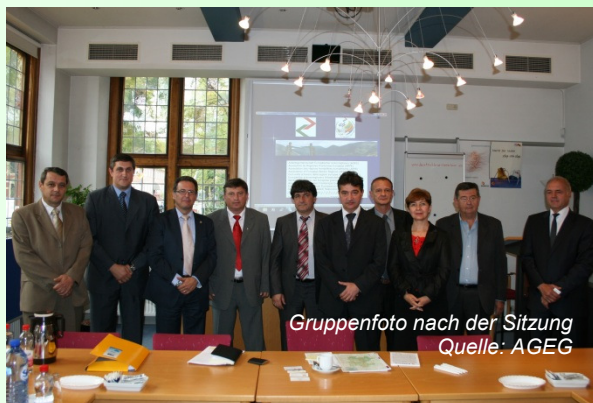
Gruppenfoto nach der Sitzung

http://www.aebr.eu/en/news/news_detail.php?news_id=116