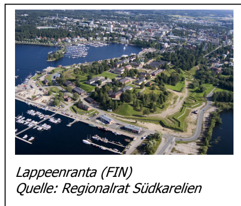
Lappeenranta (FIN)

http://www.interreg4c.net/load/2007-09-26_IVC_Programme_Manual_Final.pdf .