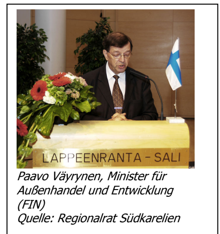
Paavo Väyrynen, Minister für Außenhandel und Entwicklung (FIN)

Die Diskussion zur neuen Nachbarschaftspolitik der Gemeinschaft am ersten Tag der Konferenz wurde angestoßen von Emma Udwin, Kabinettsmitglied der EU-Kommissarin für Außenbeziehungen und europäische Nachbarschaftspolitik, die die Aufgaben, Ziele und Herausforderungen der europäischen Nachbarschaftspolitik aus Sicht der EU-Kommission erläuterte. Die Position und Erwartungen der finnischen und russischen Regierung in Bezug auf die zukünftige