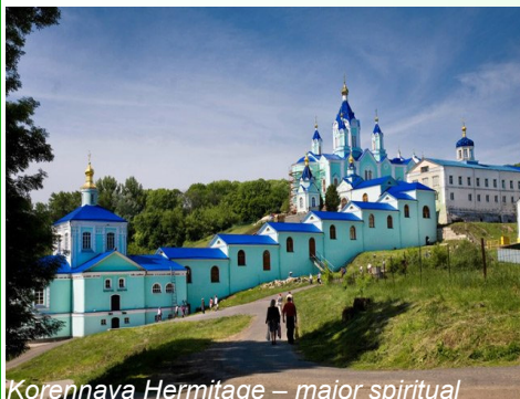
Korennaya Hermitage – major spiritual

Cette année le sujet de la conférence annuelle de l'ARFE sera « La coopération transfrontalière paneuropéenne : L'Union européenne, la Fédération de Russie et les pays de voisinage et de préadhésion ». Tous les adhérents et amis de l'ARFE sont cordialement invités à participer aux manifestations de l'ARFE à Moscou et Kursk et à fêter avec nous le 40 ème anniversaire de la fondation de l'ARFE!