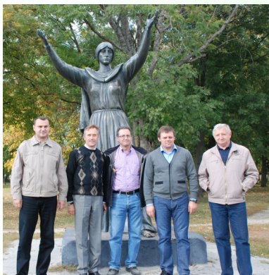
Przedstawiciele regionu Sumy z Sekretarzem Generalnym SERG przy pomniku w miejscowości Putyvl