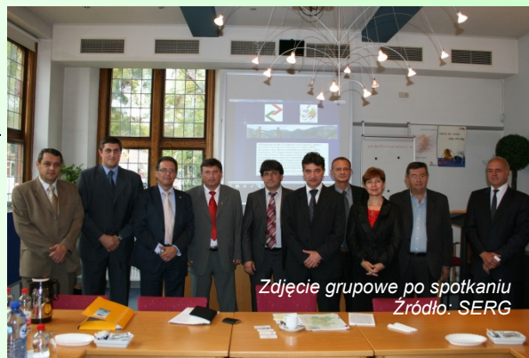
Zdjęcie grupowe po spotkaniu

http://www.aebr.eu/en/news/news_detail.php?news_id=116