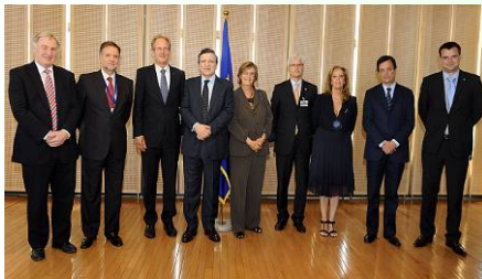
Kommissionspräsident Barroso, AdR Präsidentin Bresso und Präsidenten der Verbände