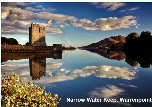
Narrow Water Keep, Warrenpoint