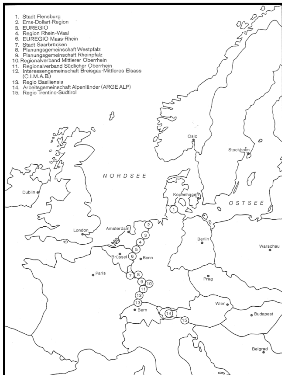
Fig. A.1.2: Miembros de la Asociación de Regiones Fronterizas de Europa (ARFE) en 1982

cooperación en todas las fronteras europeas, de integración europea y de desarrollo de programas de cooperación para las regiones de toda Europa.