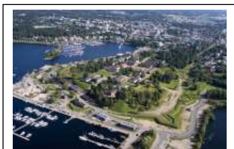
Lappeenranta (FIN)

http://www.interreg4c.net/load/2007-09-26_IVC_Programme_Manual_Final.pdf .