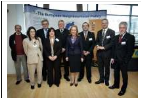
Rencontre de dialogue avec la Commissaire Benita Ferrero-Waldner

Le 18 décembre 2007, Lambert van Nistelrooij, Président de l'ARFE, interrogea la Commissaire Benita Ferrero-Waldner sur la communication entre la DG RELEX, les ministères des Relations extérieures nationaux et les régions frontalières aux frontières extérieures de l'Union européenne. Le thème de la rencontre de dialogue était « La dimension locale et régionale de la Politique de Voisinage ».