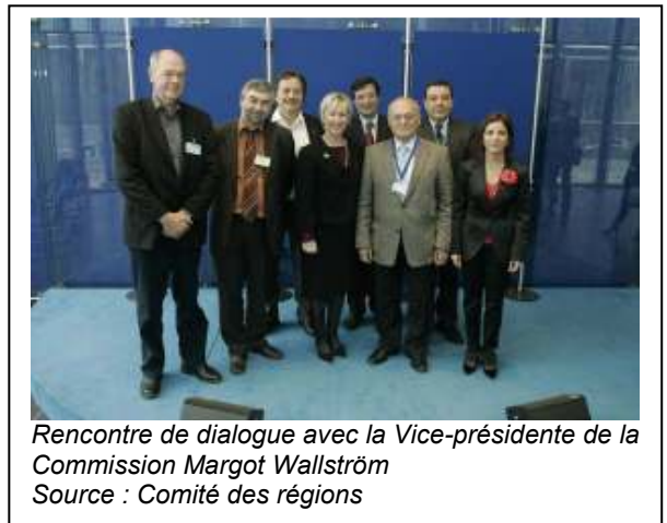
Rencontre de dialogue avec la Vice-présidente de la Commission Margot Wallström