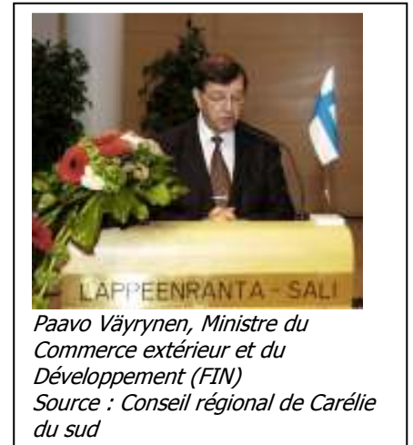
Paavo Väyrynen, Ministre du Commerce extérieur et du Développement (FIN)

La manifestation et les documents élaborés par l'ARFE furent très utiles pour fonder l'Unité opérationnelle de l'ARFE « Frontières extérieures », dont les activités sont rapportées ci-dessous.