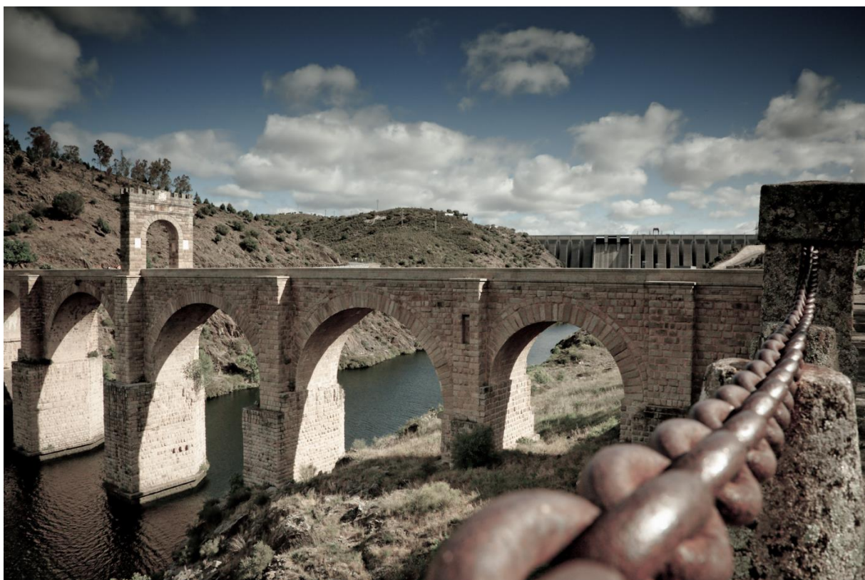
Ponte de Alcântara, localizada perto do cruzamento das fronteiras entre as três regiões Alentejo, Centro e Extremadura

Organizada por: Euroregião EUROACE - Alentejo-Centro-Extremadura Associação das Regiões Fronteiriças Europeias