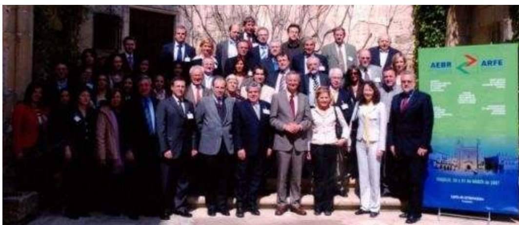
Participants à la réunion du Comité directeur de l'ARFE du 3 mars à Trujillo