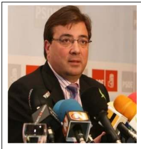
Fernández Vara

Lors de son discours d'introduction à ce point de l'ordre du jour de la réunion du Comité directeur de Trujillo (ES), le Ministre régional de la Santé de la Région d'Estrémadure,