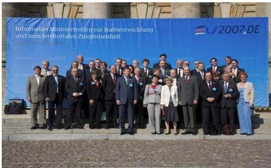
Photo de groupe des Ministres de la Cohésion territoriale

Pour de plus amples informations : www.bmvbs.de/eu2007 .